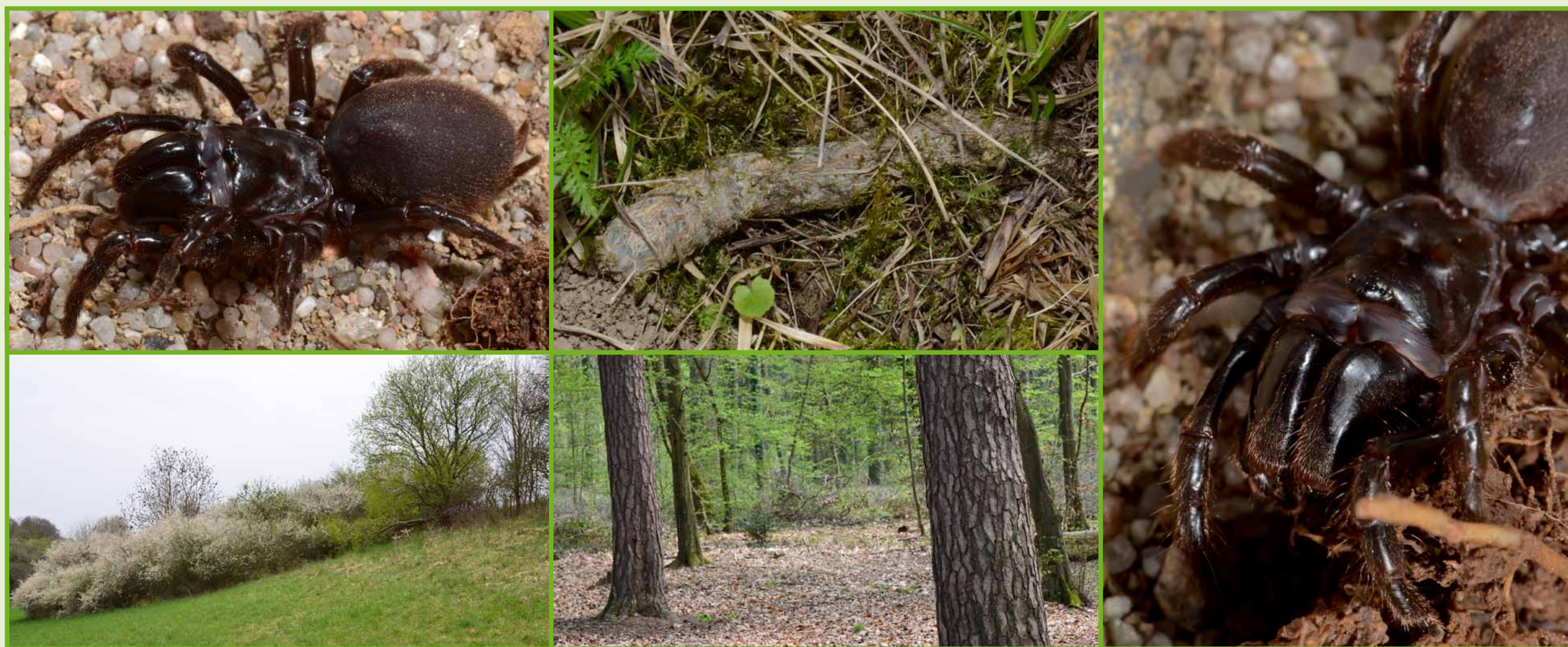
oben: Atypus affinis – die Gemeine Tapezierspinne unten: Lebensraum von Atypus piceus